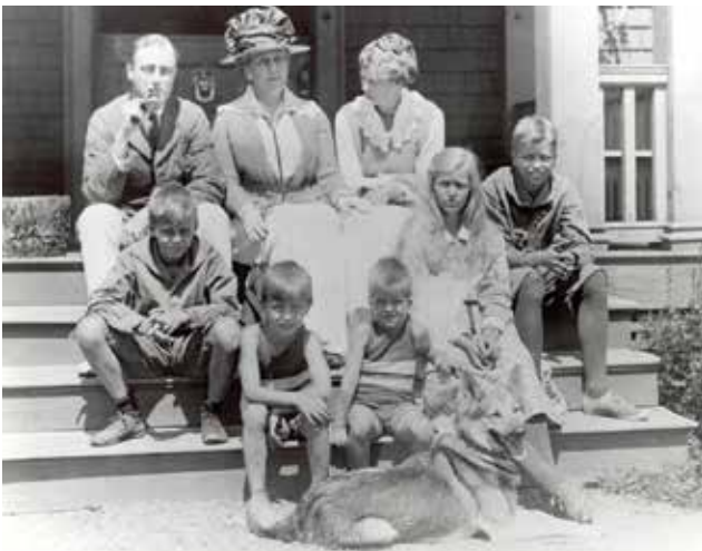
Une politique en matière de gestion des collections a été élaborée et adoptée en 2020. Celle-ci permettra d'améliorer l'intendance des collections du parc.

L'année qui vient de s'écouler a apporté son lot de défis que l'équipe du parc a relevés avec brio. Le personnel a fait preuve d'une flexibilité incroyable et d'un attachement sans faille au succès de l'organisation.